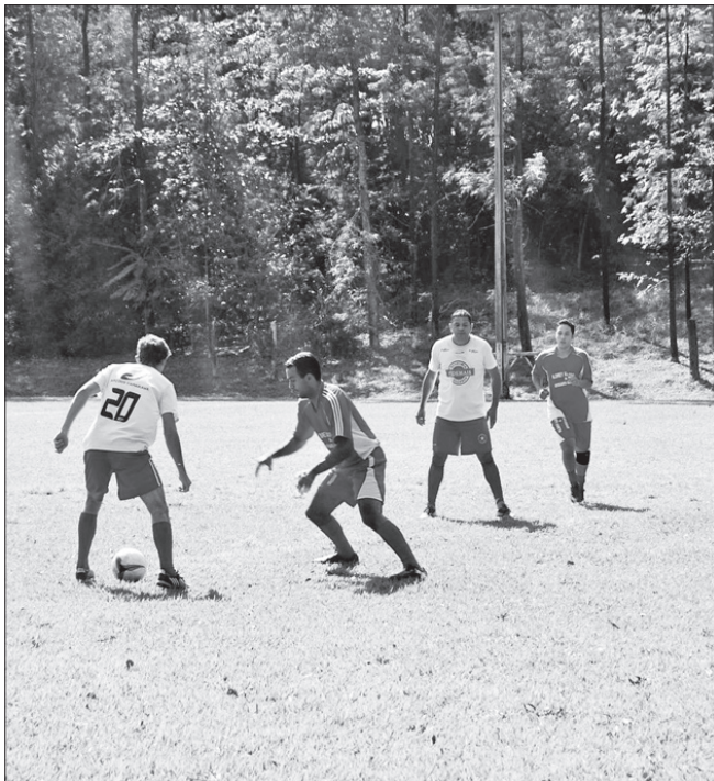
Lance de um jogo pela Copa Consórcio de Futebol Suíço