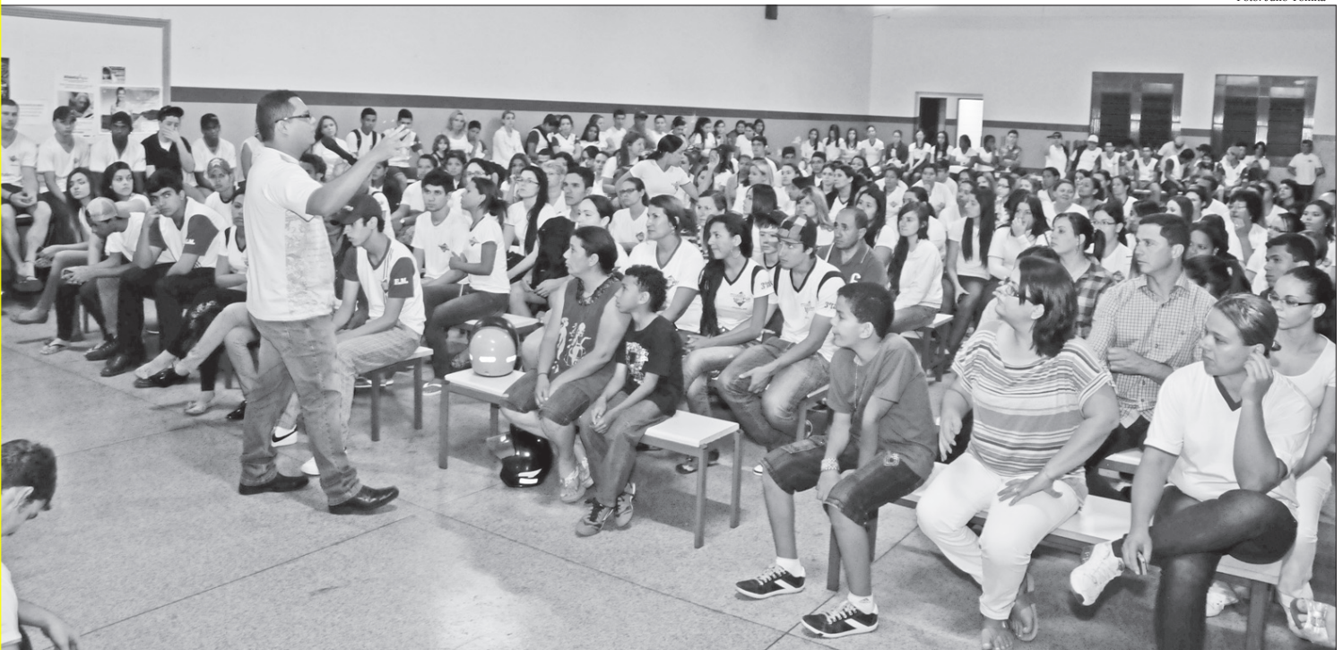
Momento do evento realizado na Unidade Polo